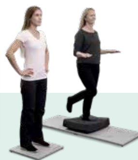
Plataformas estáticas Bertec® Portable Essential y Portable Functional