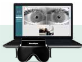
VisualEyes 505 Vídeo Frenzel