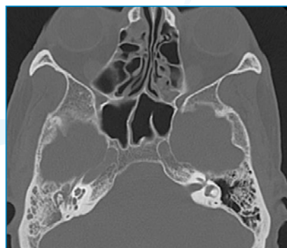
FIGURA 1: Corte axial tomográfico con ocupación de caja timpánica y mastoides derecha.

Evolución y comentarios: Inicialmente cursó tórpidamente por cefalea de perfil postural con o sin vómitos, que van mitigando con tratamiento sintomático y