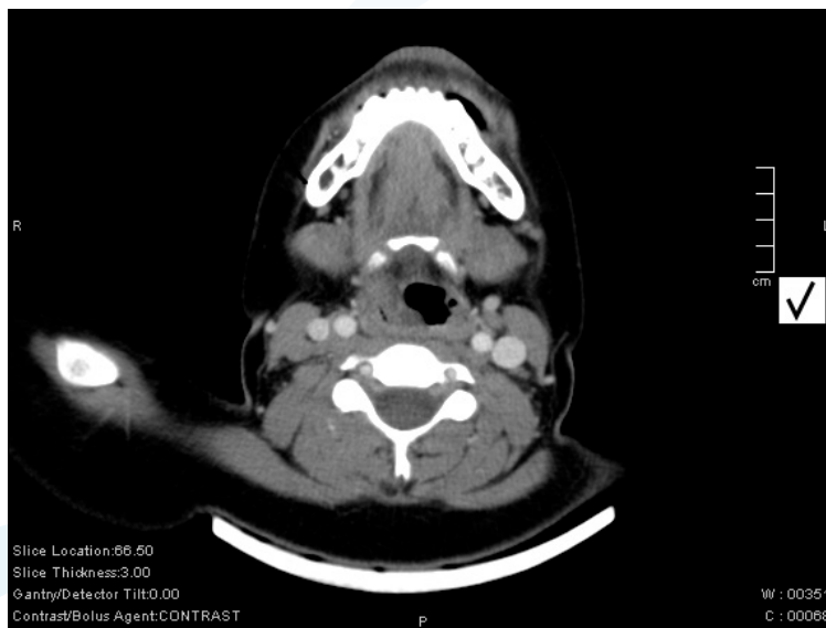
FIGURA 1: TAC cervical con contraste.

Tras el diagnóstico de flemón región hipofaríngea se pauta tratamiento intravenoso con amoxicilina-clavulámico 1 gr, metilprednisolona 60 mgr, omeprazol 40 mgr y paracetamol 1 gr. A las 48 horas y ante la no mejoría del cuadro e inicio de sangrado a través de cavidad oral, se realiza nueva nasofibrolaringoscopia, en la cual se visualiza disminución del edema que permite ver cuerpo extraño transparente adherido a pared posterior faríngea.