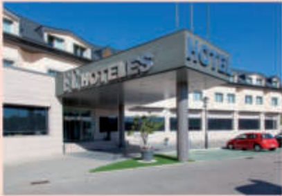
Hotel FC Villalba 4*