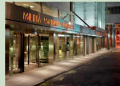
Hotel Meliá Madrid Princesa 5*

https://www.exehotels.com/exe-moncloa.html