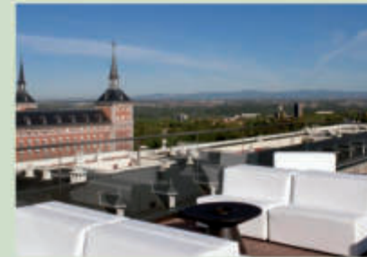
Hotel EXE Moncloa 4*

https://www.exehotels.com/exe-moncloa.html