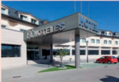
Hotel FC Villalba 4*