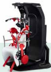
Sillón TRV Diagnosticar y tratar el vértigo postural paroxístico benigno (VPPB)