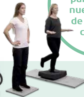
Plataformas de equilibrio Quest Force Portable Essential y Portable Functional