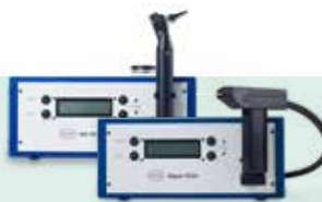
Air Fx & Aqua Stim Irrigadores versátiles calóricos de aire y agua